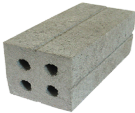
Gạch ống 8x8x18 cm