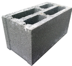
Gạch block 19x19x39 cm