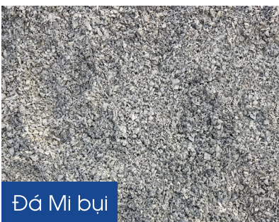
Đá Mi bụi