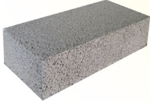
Gạch đĩnh 4x8x18 cm