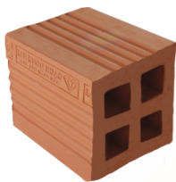
Gạch đờmi 8x8x9 cm

Địa chỉ: Khu phố Tân Mai, phường Phước Tân, thành phố Biên Hoà, tỉnh Đồng Nai.