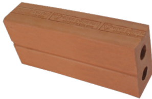
Gạch đinh 4x8x18 cm