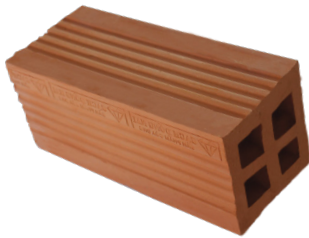
Gạch ống 8x8x18 cm