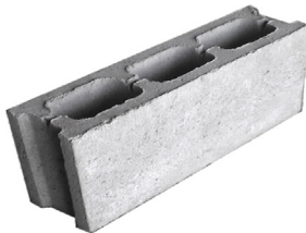
Gạch block 9x19x39 cm