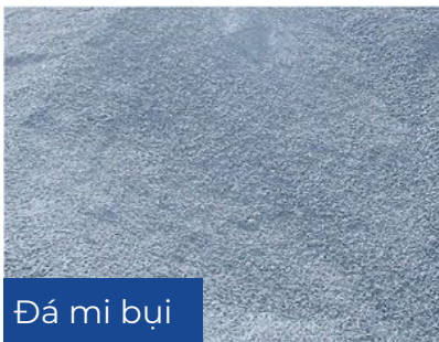
Đá mi bụi

Công suất khai thác chế biến đá: 1.000.000 m 3 /năm