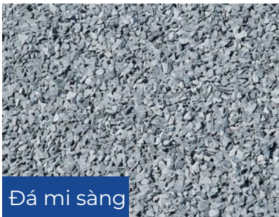
Đá mi sàng